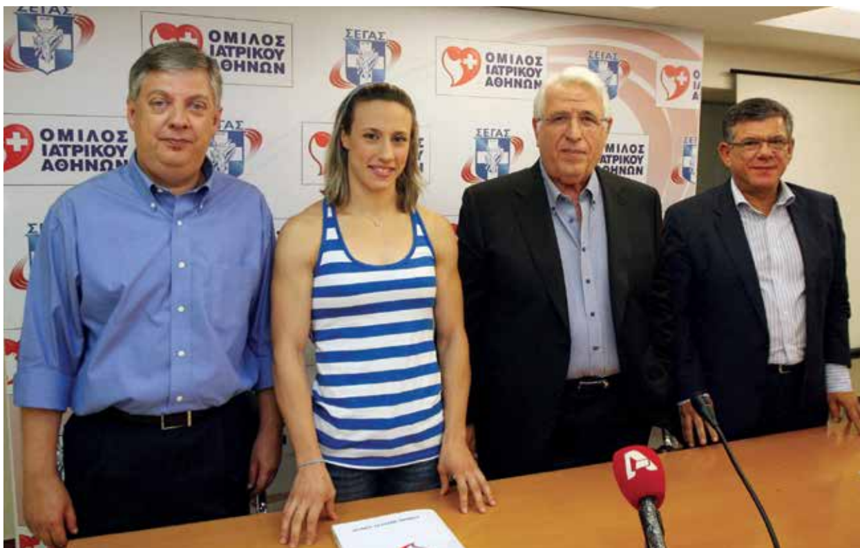
Ο Πρόεδρος του ΣΕΓΑΣ, Κώστας Παναγόπουλος, η πρωταθλήτρια επί κοντώ Νικόλη Κυριακοπούλου, ο Πρόεδρος του Ομίλου Γιώργος Αποστολόπουλος και ο Γενικός Οικονομικός Διευθυντής του Ομίλου Μανώλης Μαρκόπουλος.